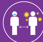
Hạn chế tiếp xúc với bệnh nhân cúm