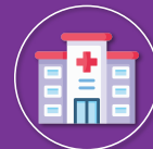
Đến cơ sở y tế để được khám, xử trí kịp thời