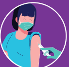
Tiêm vắc xin cúm mùa