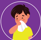
Che miệng khi ho