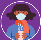
Giữ ấm cơ thể