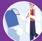
Sử dụng thuốc phải theo hướng dẫn của bác sĩ