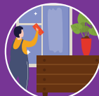
Thường xuyên vệ sinh các bề mặt, vật dụng