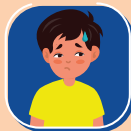
Sốt, mệt mỏi