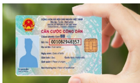
Căn cước công dân