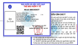
Thẻ bảo hiểm y tế